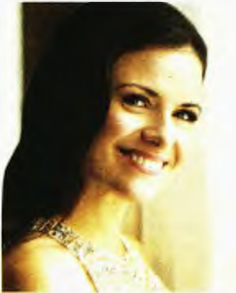
Πρωτοχρονιάτικη Συνελεύση ΚΟΘ - «Σίσσυ»

EPT3: Με ένα καινοτόμο πρόγραμμα υποδέχεται τη νέα χρονιά η κρατική τηλεόραση της βόρειας Ελλάδας