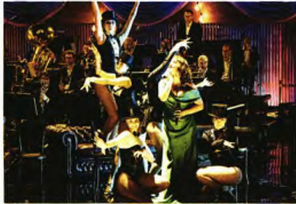
«The Babylon Hotel»